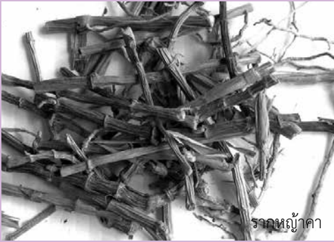
รากหญ้าคา