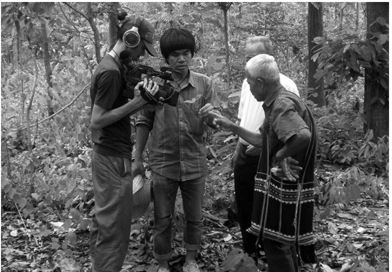
การถ่ายทำรายการลุยไม่รู้โรย