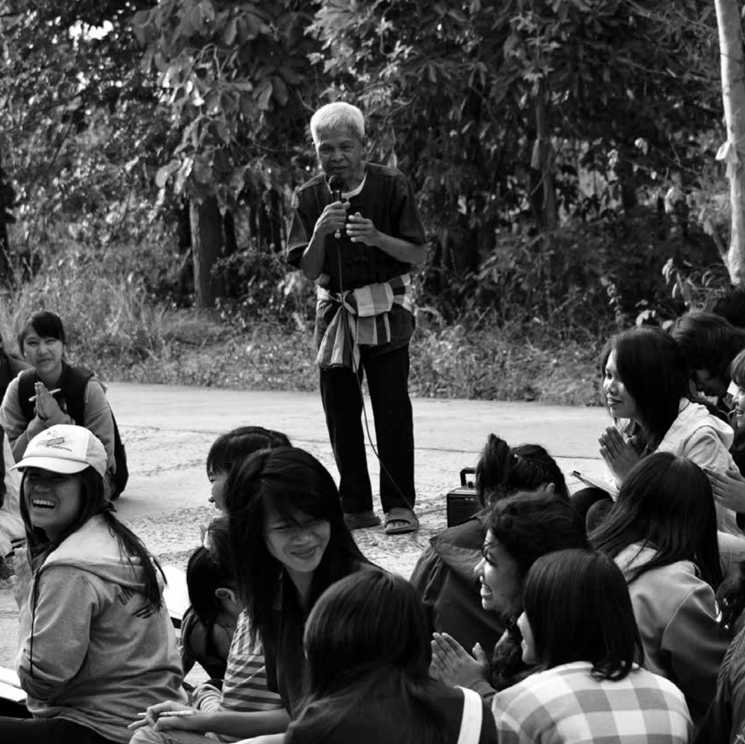
การบรรยายแนวทางการอนุรักษ์ป่าและศึกษาสมุนไพรในป่าชุมชน ต.ดงเค็ง ให้กับนักศึกษา มหาวิทยาลัยขอนแก่น