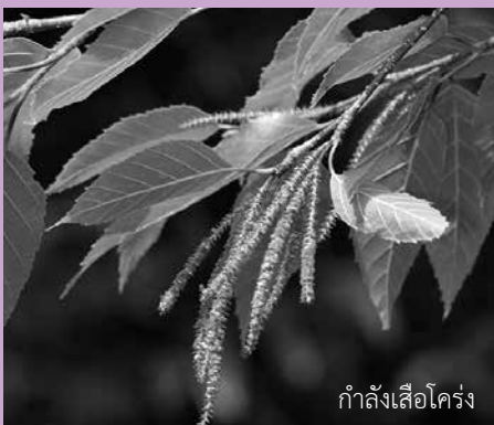
กำลังเสือโคร่ง