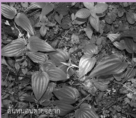
ดินหนอนตายอยาก