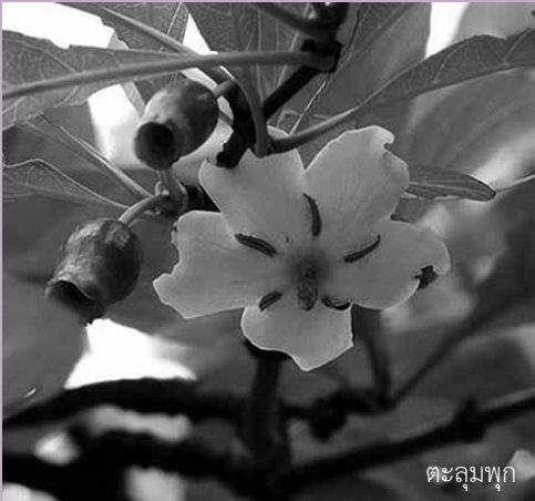
ตะลุมพุก