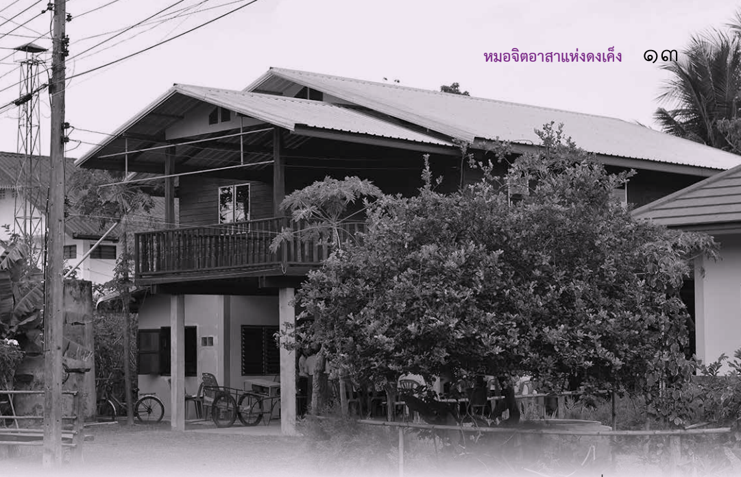
บ้านของพ่อหมอขาว ฉียบแหลมและครอบครัว ที่ตำบลดงเค็ง