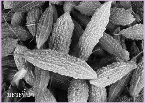
มะระขี้เทย