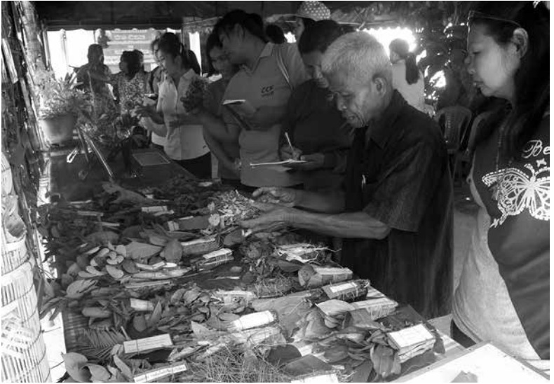
การจัดนิทรรศการเผยแพร่องค์ความรู้ เรื่อง สมุนไพร ในวันต้อนรับสาธารณสุขนิเทศก์ เขต ๗