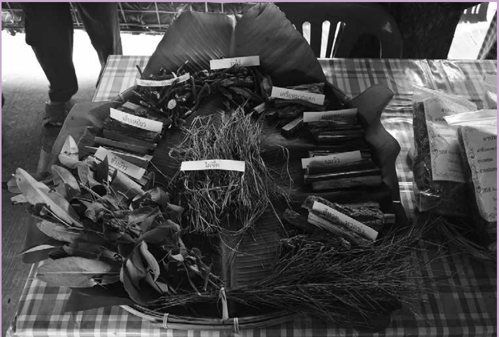
ภาพแสดงตำรับยาประสิทธิ์ห้าขมิ้น