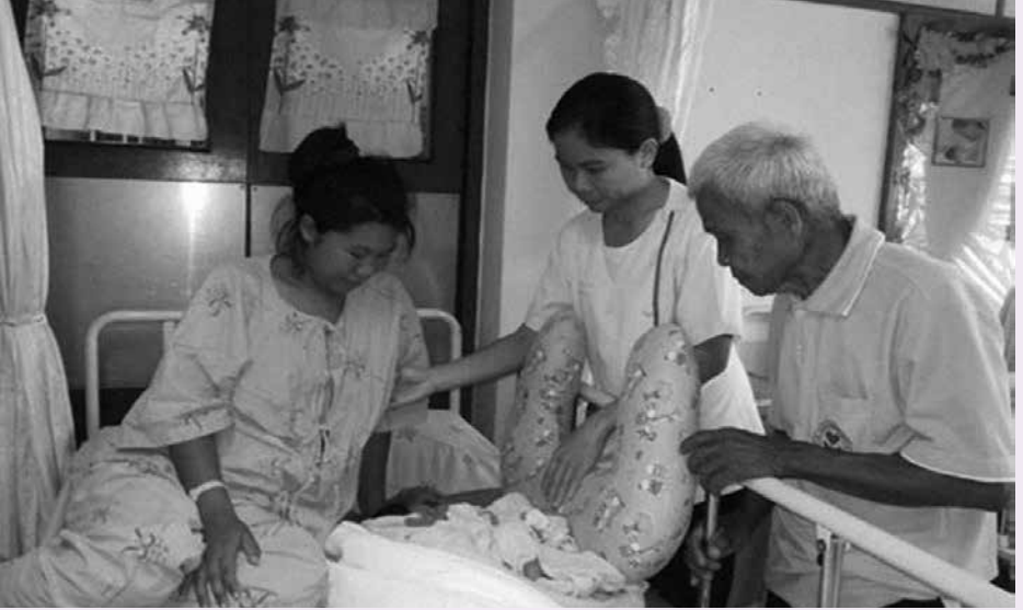
พ่อขาว เขียบแหลม ตรวจแม่หลังคลอดร่วมกับแพทย์แผนไทย ณ ตึกหลังคลอด โรงพยาบาลหนองสองห้อง