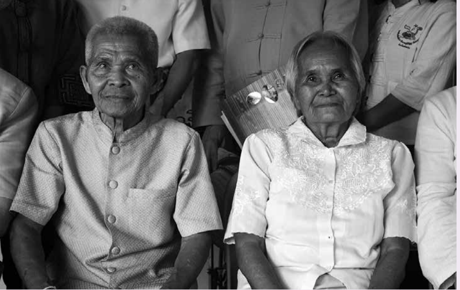
พ่อขาว ฉะยิบแหลม และแม่แม่ฉะยิบแหลม (ภรรยา)