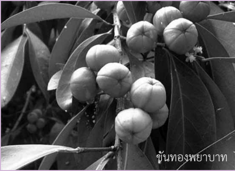
ขึ้นทองพญาบาท