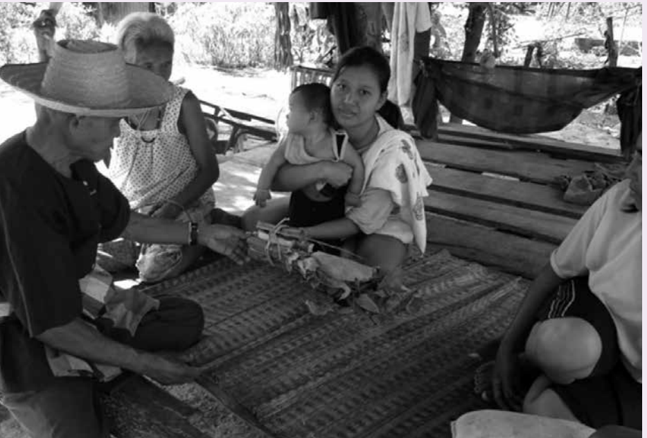
เยี่ยมบ้านแม่หลังคลอด ที่มีปัญหาน้ำนมไม่เพียงพอให้ลูกกิน