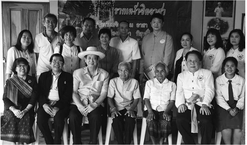
คณะกรรมการพิจารณาคัดเลือกหมोजิตอาสาดีเด่นแห่งชาติ ปี ๒๕๖๑ ลงพื้นที่ตรวจเยี่ยมให้กำลังใจ