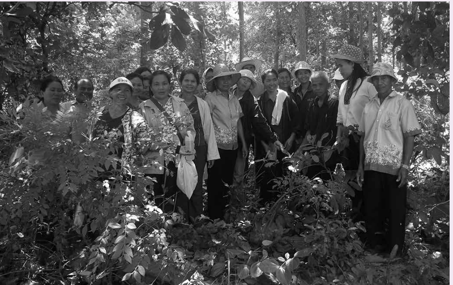
พ่อขาว ฉะยิบแหลม พา อสม. ต.ดงเค็ง เดินป่าศึกษาสมุนไพร