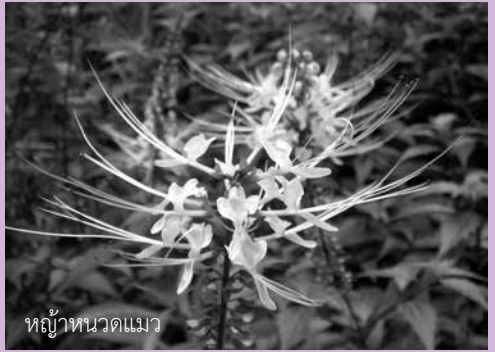
หญ้าหนวดแมว