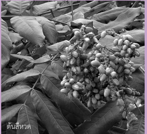
ต้นสีหวด